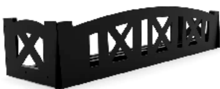
Рис. 1 - "Тироль"