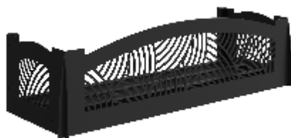
Рис. 2 - "Бриз"