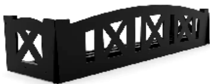
Рис. 1 - "Тироль"