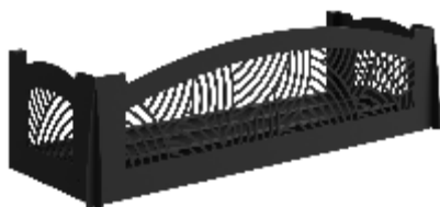
Рис. 2 - "Бриз"