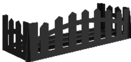
Рис. 3 - "Матроскин"